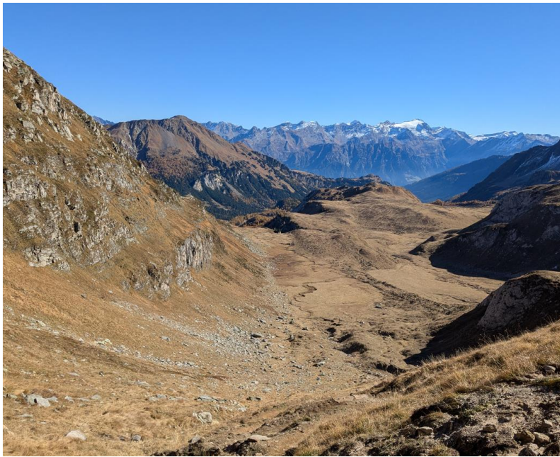
Fläche unterhalb Passo Colombe Herbst 2025