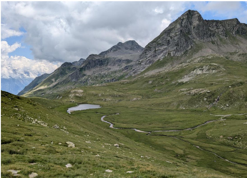
➤ unterhalb Passo del Sole